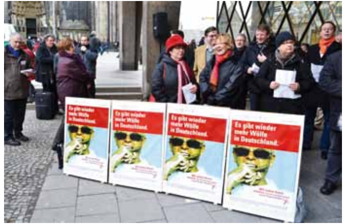
Der Wahlkampf-Song wird auf der Domplatte zum besten gegeben

haien und Heuschrecken entgegenzustellen sind die Sozialwahlen 2011. Die Sozialpartnerschaft in der Selbstverwaltung der Rentenversicherungen, der Kranken- und Pflegekassen und bei den Berufsgenossenschaften sind das Gegenmodell. Es gelte nach wie vor die Solidargemeinschaft bezüglich Rente, Krankheit, Pflege und Unfall zu sichern. Dafür stehen die christlichen Arbeitnehmerverbände, die zu den Sozialwahlen bei Renten-, Kranken- und Pflegeversicherungen und in den Berufsgenossenschaften Kandidatinnen und Kandidaten stellen. „Christliche Kraft setzen wir gegen soziale Ungerechtigkeit – gegen die Wölfe“, so Hupfauer, der die „Honnefer Erklärung“ zur Zukunft der sozialen Sicherheit als Zeichen für mehr Solidarität präsentierte. Abrufbar unter www.aca-online.de www.bvea.de