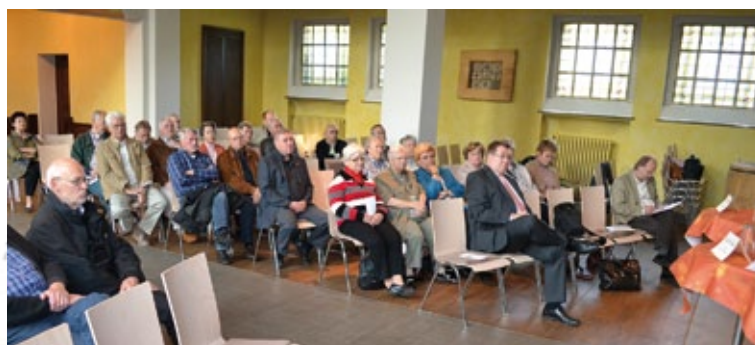
Duisburg: Lutherkirche - Seminar EAB NRW zum Thema Euro - siehe Seite 19