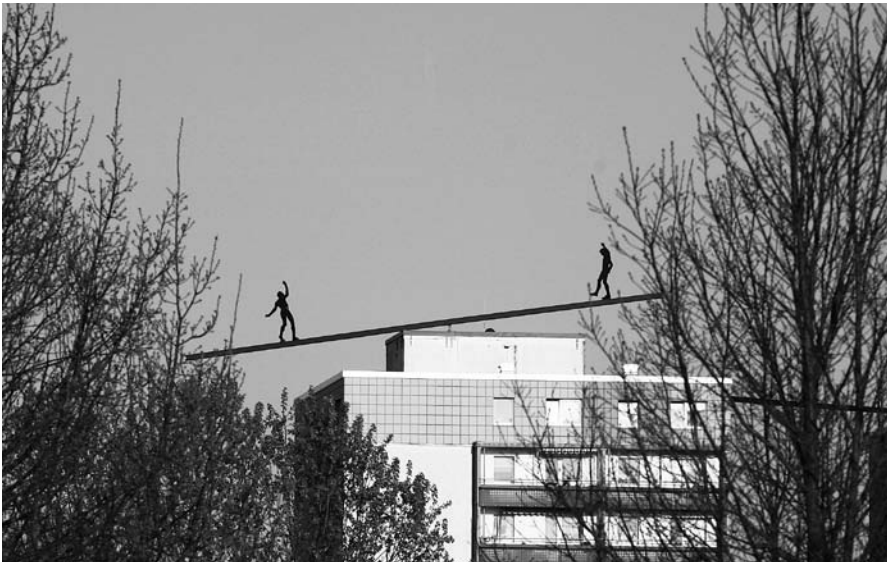
Da heißt es oben bleiben: gesehen in Berlin-Mahrdahn

Öffnung des deutschen Arbeitsmarktes für Mittel- und Osteuropa ohne sozialpolitisch, verantwortbare Regelungen und Lohndumping?